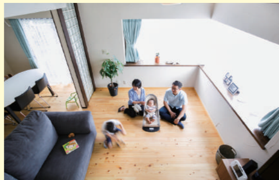
珪藻土、無垢のヒノキで調湿性能を高めたリビング

工事費内訳 / 解体 木工事 建具工事 塗装工事 屋根 雑工事 電気工事 設備工事 管理費 諸経費