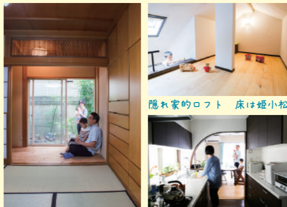
隠れ家的ロフト 床は姫小松