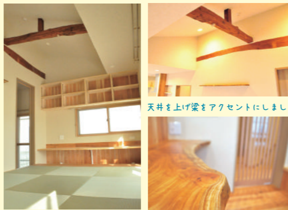
天井を上げ梁をアクセントにしました