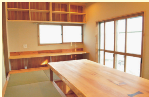
念願の畳の掘りごたつ風リビング。テーブルには無垢の一枚板を使用