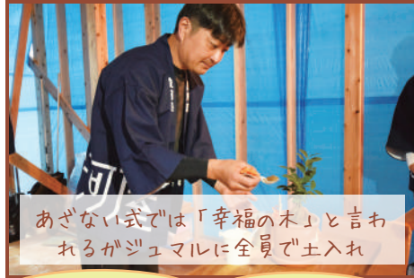
あざない式では「幸福の木」と言われるがジュマルに全員で土入れ