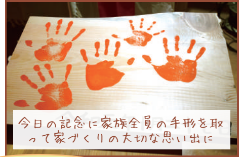
今日の記念に家族全員の手形を取って家づくりの大切な思い出に

こちらのお宅を完成後に実際にご覧いただくことができます！詳しくは下記『職人技発表会』で