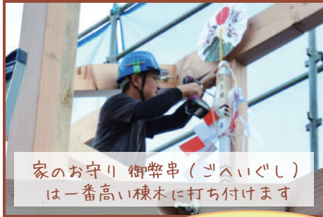
家のお守り 御幣串（ごへいぐし） は一番高い棟木に打ち付けます

家づくりにおいて、建物の骨組みを組み上げることを「上棟」と言い、新築工事の中でももっとも大変な工程の一つです。先日品川区の様邸で、無事に上棟したことをお祝いする「上棟式」が行われました。駿河屋では上棟という節目が家づくりの良い思い出になるよう、皆さんが楽しめる上棟式をご用意しています。