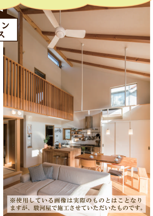
※使用している画像は実際のものとはことなりますが、駿河屋で施工させていただいたものです。