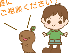
するりん しゅんたろう

【注意点】 ○オンライン相談に使用するパソコン・スマホ・タブレット、インターネット環境はお客様ご自身でご用意ください。 ○相談時にかかる通信料はお客様のご負担となります。 ○当日の通信環境の状況により、ご相談を中止・延期させていただく場合がございます。