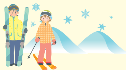
駿河屋九代目当主 一桝

1月号で年始のご挨拶をしようと思ったら、雪村に「年末に届くのに新年のご挨拶なんておかしくないですか〜?」と言われ、そっかあ?と思ってたらあっという間に年明け!よく考えたら1月号が年末に届いても新年のご挨拶はどの媒体でもしてますよね?ということで新年のご挨拶をしそになったワタクシですが、本年もどうぞ宜しくお願い致します。さて、私の正月休みはというと、息子が「スノーボードやりたい」というので、「よし!行こう!」という事になりましたが、インドアの娘は留守番宣言。カミサンには「アナタの大切な王子が行きたいと言うのだから行きますよね?」と無理矢理引きずり出し3人でスキー場へ行ってきました。王子はさっさとスクールに放り込んで、僕はカミサンと2人でスキー!懐かしいウエアにフードとマスクをすると、もはや結婚当初のカミサンではないか!僕は独身時代さながらにかいがいしく、ブーツを履かせたり、スキーを運んだり、全てお世話したらご満悦。「また行こうね〜♪」って事になりました。本年もどうぞ宜しくお願い致します。