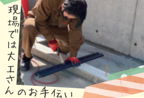
店舗前の端材の準備中