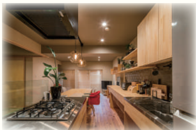
<ペニンシュラタイプ>

近年人気の設備であるシステムキッチンですが、違いや特徴、メリットについてご紹介します。