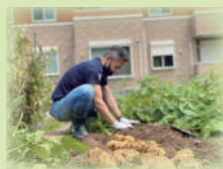
秋はさつまいもですよ〜

駿河屋では創り手の想いや物語を伝えるために、自らが創り手となり作業の大変さや苦勞を理解し、創り手の気持ちを体感することの一環として野菜をつくっています。今回は春に種付けし、農薬を使わずに育てたじゃがいもの収穫をしました(^)/今年はずきがよく豊作でした!