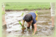
収穫が楽しみですね♪