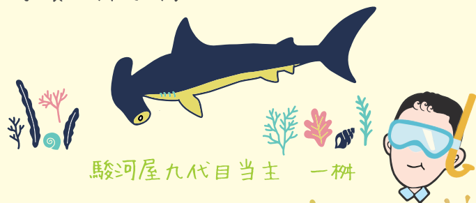
駿河屋九代目当主 一枘

当然、体験ダイビングはもっと安全なところの 可愛いお魚がキラキラ舞い踊っている海です♪