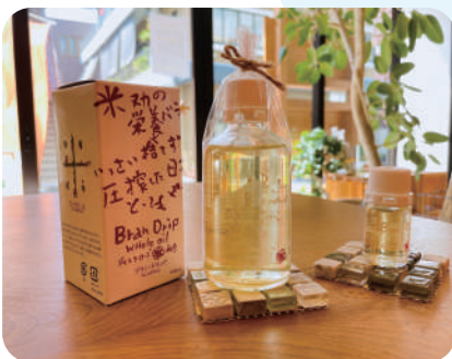
100ml 4400円 / 10ml 550円(税込)

LINE 友だち登録で ブランドリップ10ml プレゼント中！ 登録方法は裏面で