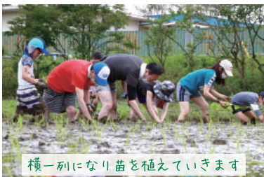
横一列になり苗を植えていきます

現代は大量生産し、大量消費があたりまえとなり創り手の顔の見えない時代になりました。モノへの愛着や感謝も昔にくらべて薄くなっているのかなと感じます。