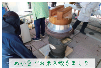
ぬか釜でお米を炊きました