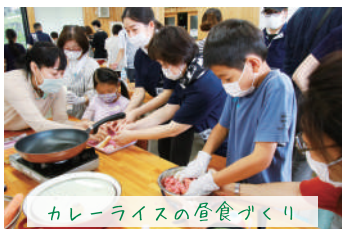
カレーライスの食卓づくり

家づくりをおこなう私たちも生産者の気持ちを知るための貴重な機会にさせてもらっています。