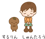
するりん しゅんたろう

掲載のイベントに関しましてコロナウイルス等の状況によっては中止とさせて頂く場合がございます。また、ご来場の際に体調不良や風邪などの症状があるかたはご来場のご遠慮をお願いいたします。マスクの着用は個人の主体的な判断を尊重いたしますが、周囲の方やご自身を守るための判断を推奨いたします。