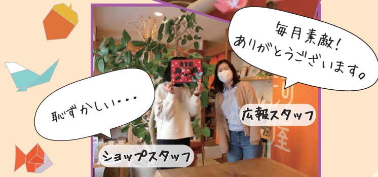
ショップスタッフ