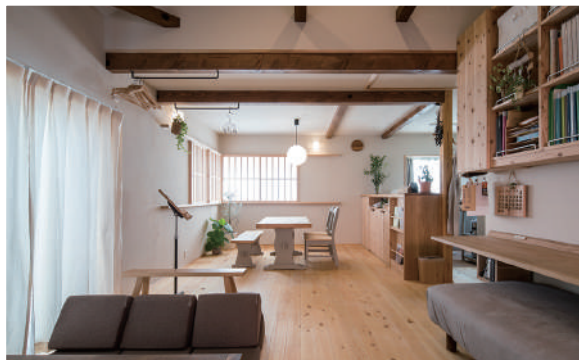
画像は当社で施工したイメージです