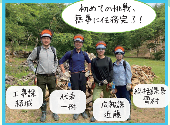
初めての挑戦、無事に任務完了!

5月15日にとうきょう林業サポート隊として、山へ雪害木処理に行きました。「とうきょう林業サポート隊」は、ボランティアとして森づくりをサポートする活動を行っています。今回の任務「雪害木処理」とは、その名の通り、雪で折れたり、曲がったりして成長できない木を、伐採する作業なのですが、初参加の私たちは、ビックリ!本格的に木を伐り倒して行くんです!!