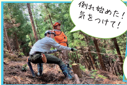
倒れ始めた! 気をつけて!