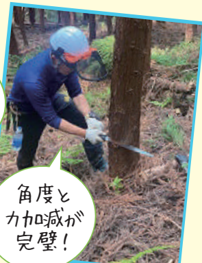
角度と 力加減が 完璧!

木の伐採は、安全第一!!林業専門家の指導員の丁寧な指導の下、みんなと協力して上手に伐り倒すことができました!!この日はとても暑い日でしたが、森の中は日陰でとてもすずしやすかったです。大自然に囲まれてリフレッシュでき、森林を守る大切さを学べて良い日となりました~(^.^)