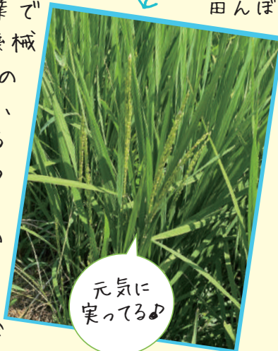
元気に実ってるよ

できると思います。当日、天気が良いことを祈りながら、後日の報告を楽しみにしててくださいね(^^)v♪