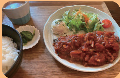
サバのトマト煮 ライス・みそ汁セット 990円(税込) (数量限定)

先日、ランチにサバのトマト煮をいただきました。このメニューは数量限定で、ママさんが丁寧に骨抜きしたサバをたっぷりトマトソースで煮込んだ一品です。サバはとてもやわらかくて、ご飯がどんどん進みます。青魚に多く含まれる「DHA・EPA」とトマトの「リコピン」をたっぷり摂取でき、体がとても喜ぶメニューです。