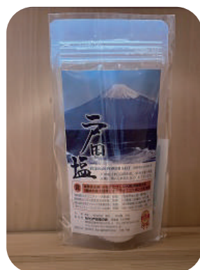
◎戸田塩 100g ¥550(税込)

駿河湾の黒潮から生まれる「戸田塩」は、ミネラル豊富でまろやかな味が特徴の自然海塩です。長時間かけて薪で炊き、添加物ゼロの伝統製法で手作りされています。素材の味を引き立てるその風味は、体と心と環境にとっても優しいです。秋の料理をさらにおいしくお楽しみ使ってみてね(^^)!