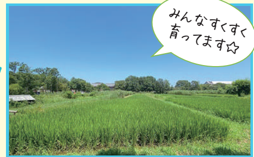
みんなすくすく育ってます☆